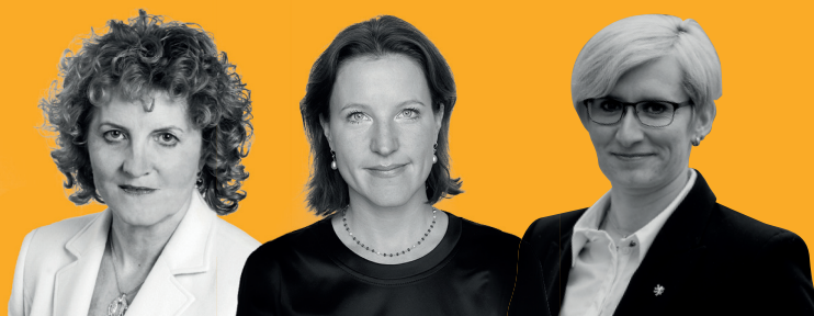
VLASTA PARKANOVÁ KDU-ČSL