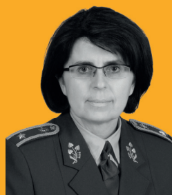
LENKA ŠMERDOVÁ PRVNÍ GENERÁLKA ARMÁDY ČR